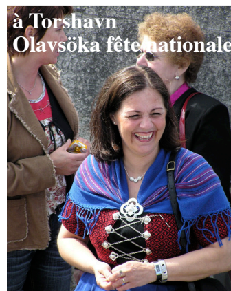
à Torshavn Olavsöka fête nationale

N'oubliez pas : sac de couchage, jumelles, médicaments personnels, alcool si vous le désirez (on en trouve pas sur place), passeport valable (éventuellement carte